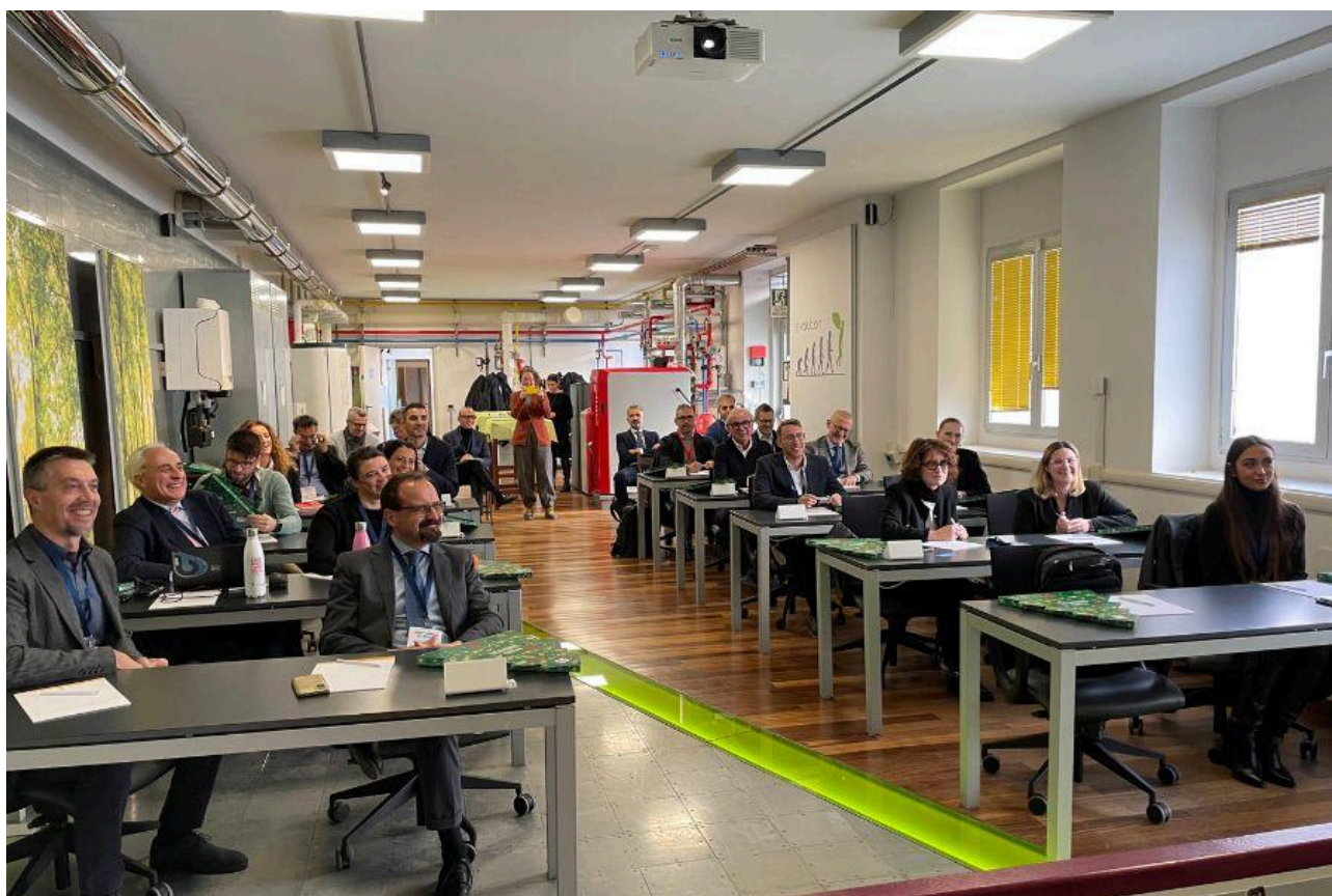
06. Partecipanti alla riunione annuale soci ANICA 2024

ASSOCIAZIONE NAZIONALE INNOVAZIONE COMFORT AMBIENTE