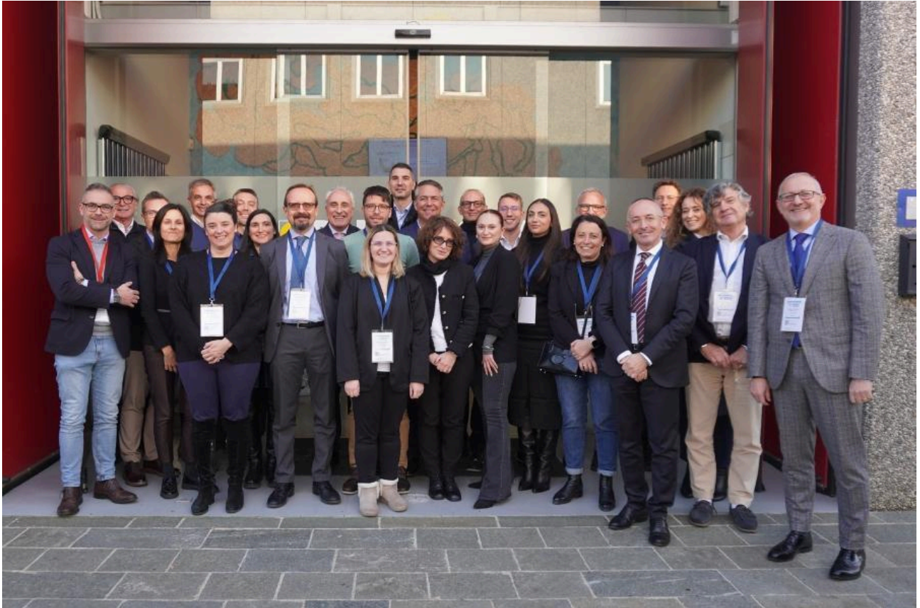
01. Foto di gruppo realizzata durante l'Assemblea Nazionale dei Soci Anica, 12 dicembre 2024, Calcinato (Brescia) presso la sede di Paradigma Italia S.p.A.

all'adozione di tecnologie ma che alimenta una cultura della sostenibilità che ispira e guida il settore e ne promuove l'integrazione in un approccio olistico multi tecnologia.